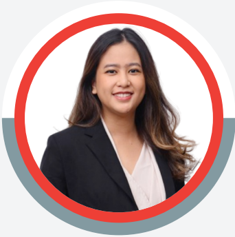
Dame Sola Gratia FX & Investment OCBC