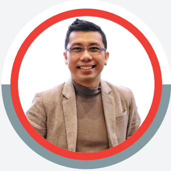
Lex dePraxis Relationship Coach